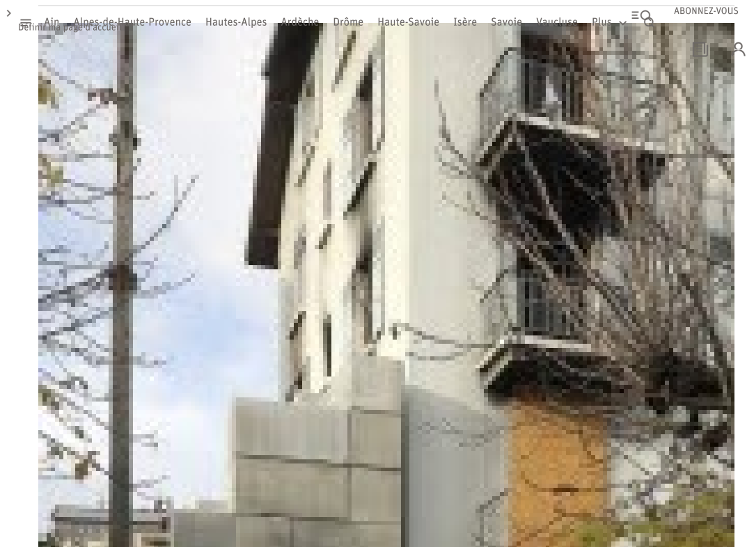
L'immeuble aux fenêtres barricadées, consolidé par des blocs béton empilés, est toujours mis en péril.

Au 7, rue du Forum, le silence règne. L'immeuble aux fenêtres barricadées, consolidé par des blocs béton empilés, est toujours mis en péril. Depuis la nuit du drame, aucun des 16 habitants de l'immeuble violemment secoué n'a pu remettre les pieds chez lui. Au-delà du traumatisme et de la perte de deux voisins chers, un sentiment unanime d'isolement domine.