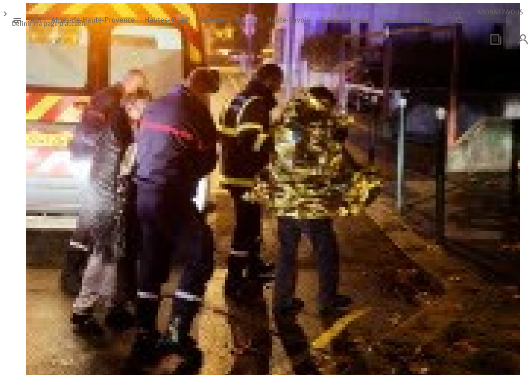
90 sapeurs-pompiers ont été mobilisés pour prendre en charge 17 habitants de l'immeuble qui ont pu sortir par leurs propres moyens après l'explosion.